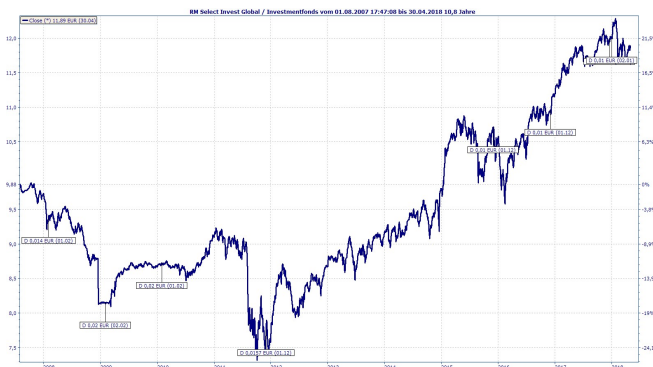
Wertentwicklung des Fonds in Prozent auf Monatsbasis (nach BVI)